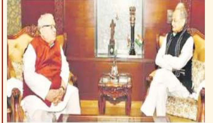
सीएम अशोक गहलोत ने राजभवन पहुंच राज्यपाल कलराज मिश्र से मुलाकात की। इसे सिध्दावर मुलाकात बताया गया।